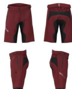
696 Red Pompeian