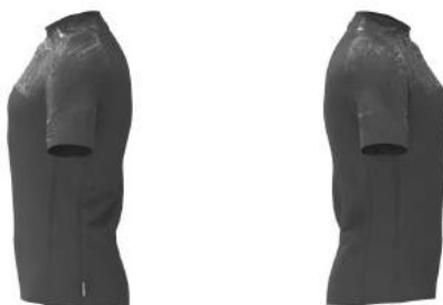
850 Grey Md Steel