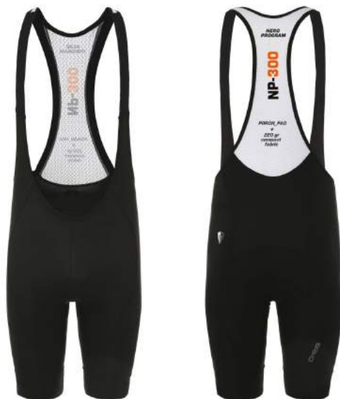
900 N003 BLACK