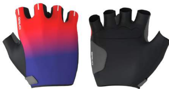
907 Orange Flame