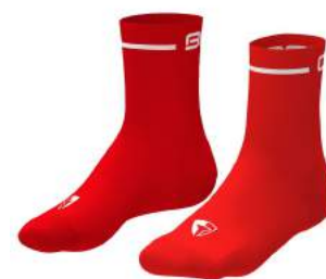
B06 Orange Flame