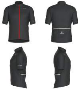
133 Grey Dk