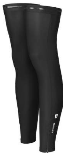
900 NO03 BLACK