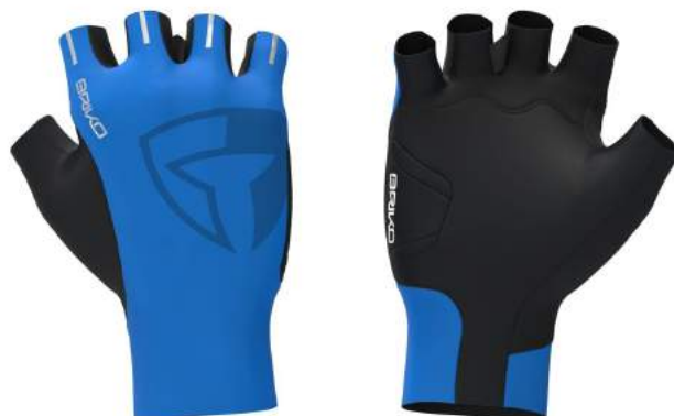
933 Azzurro ITALIA-Black