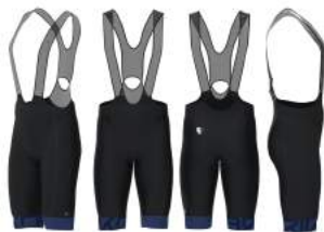
921 Black-Blue Print