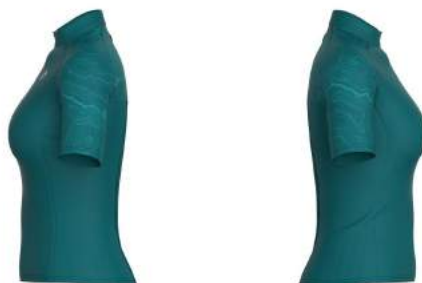
157 Blue Deep Lake