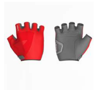
936 Grey Dk-Red