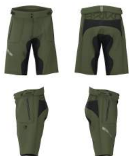
297 Green Dk Forest