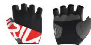
932 Orange Flame-Black