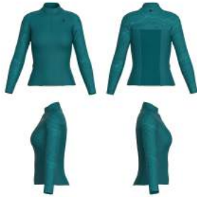
157 Blue Deep Lake