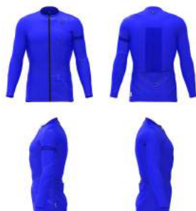
353 Blue Royal