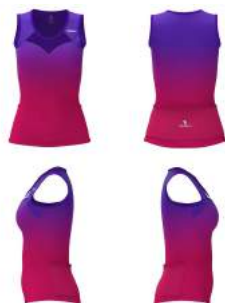
913 Violet Heliotrope