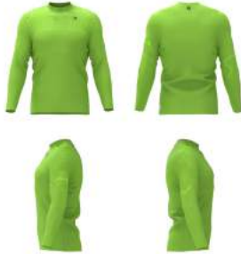
B33 Green Lime Punch