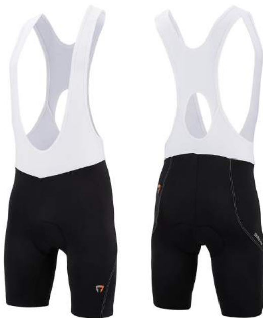
909 N029 BLACK-WHITE