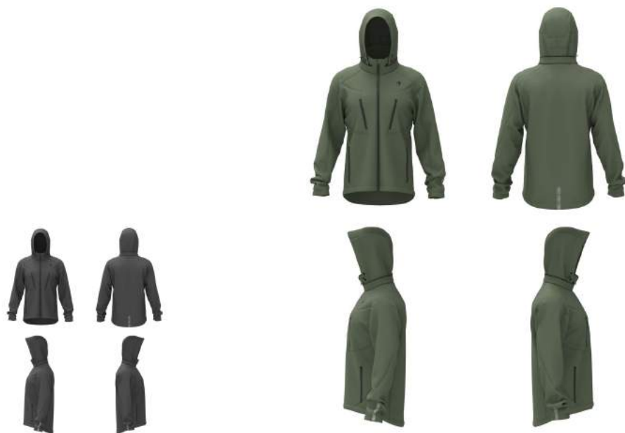
133 Grey Dk