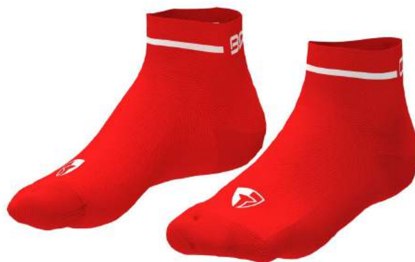
B06 Orange Flame