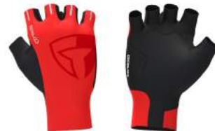
932 Orange Flame-Black