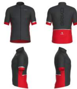
910 Grey Dk-Orange Flame