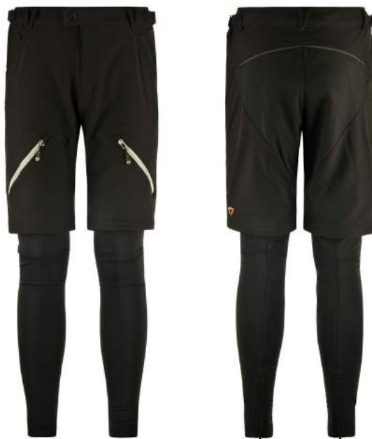
900 N003 BLACK