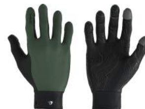
935 Green Dk Forest