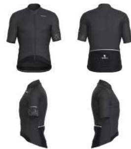
917 Grey Dk-Black