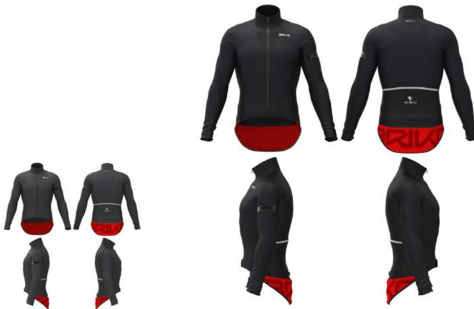
133 Grey Dk