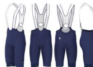
X1Y Blue Md Cobalt