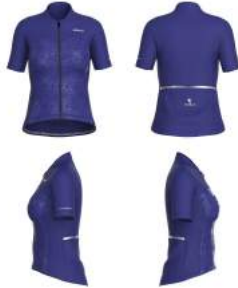
D42 Blue Clematis