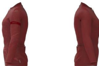
696 Red Pompeian