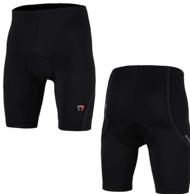
909 NO29 BLACK-WHITE