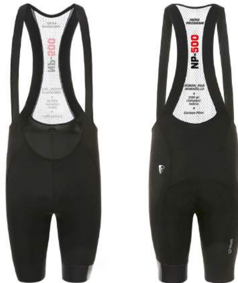
900 NO03 BLACK