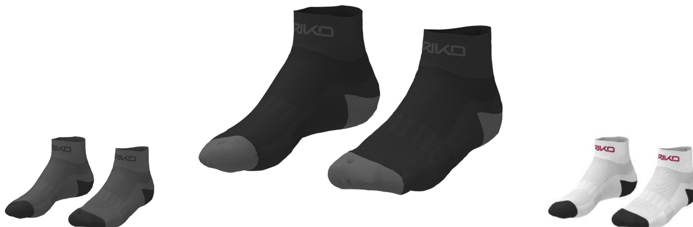
900 Black Bean-Black