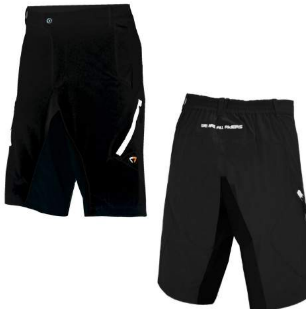
900 NO03 BLACK