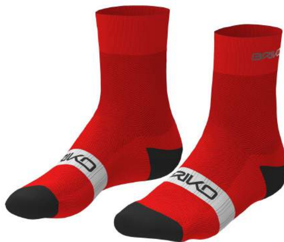
907 Orange Flame-White