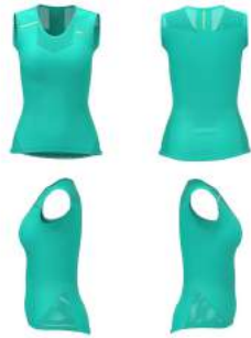
WEU Green Deep