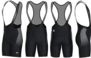
920 Black-Grey Dk