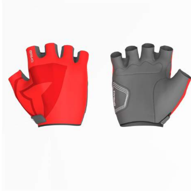
910 Grey Dk-Orange Flame