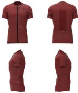
696 Red Pompeian