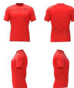
B06 Orange Flame