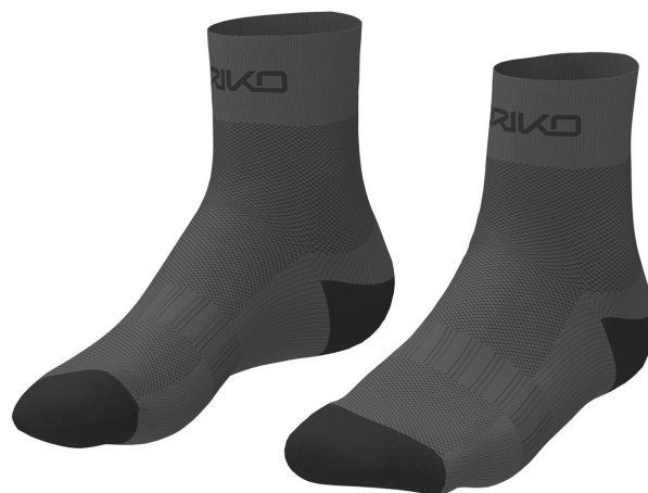
900 Black Bean-Black