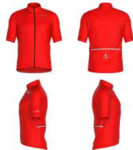
B06 Orange Flame