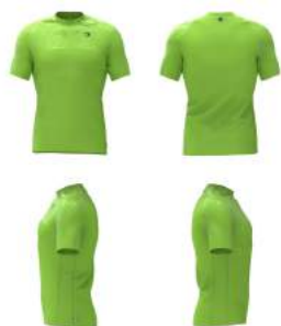
B33 Green Lime Punch