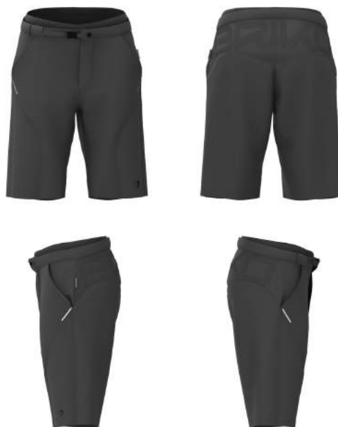
133 Grey Dk