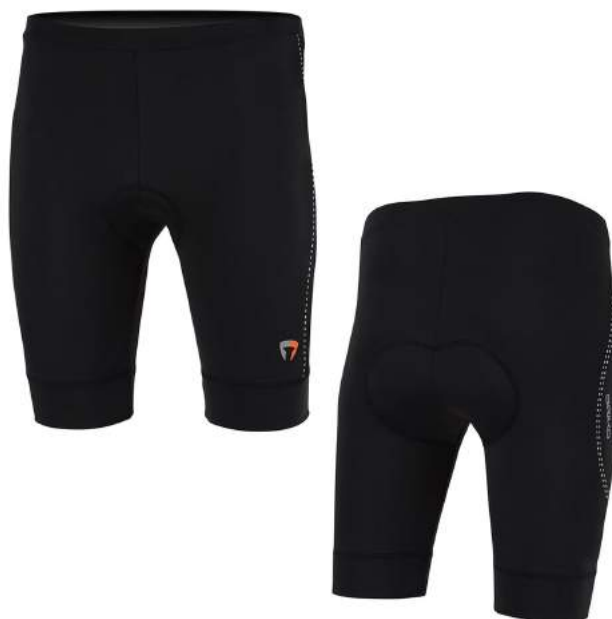
909 NO29 BLACK-WHITE