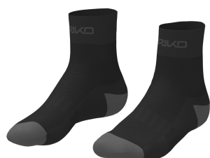
903 Black-Black Bean