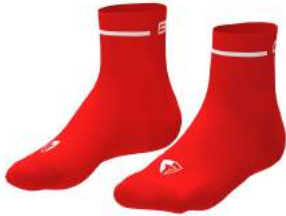
B06 Orange Flame