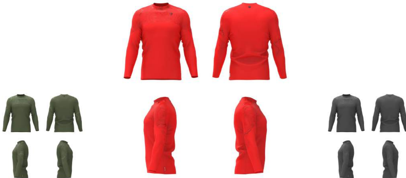
297 Green Dk Forest