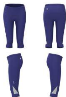
V25 Blue Print