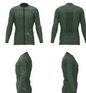
297 Green Dk Forest