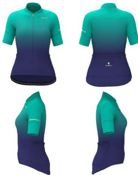
914 Green Deep