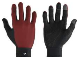
934 Red Pompeian-Black