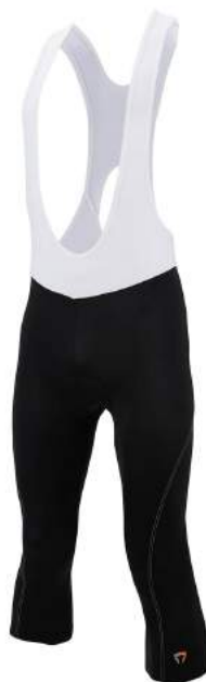
909 NO29 BLACK-WHITE