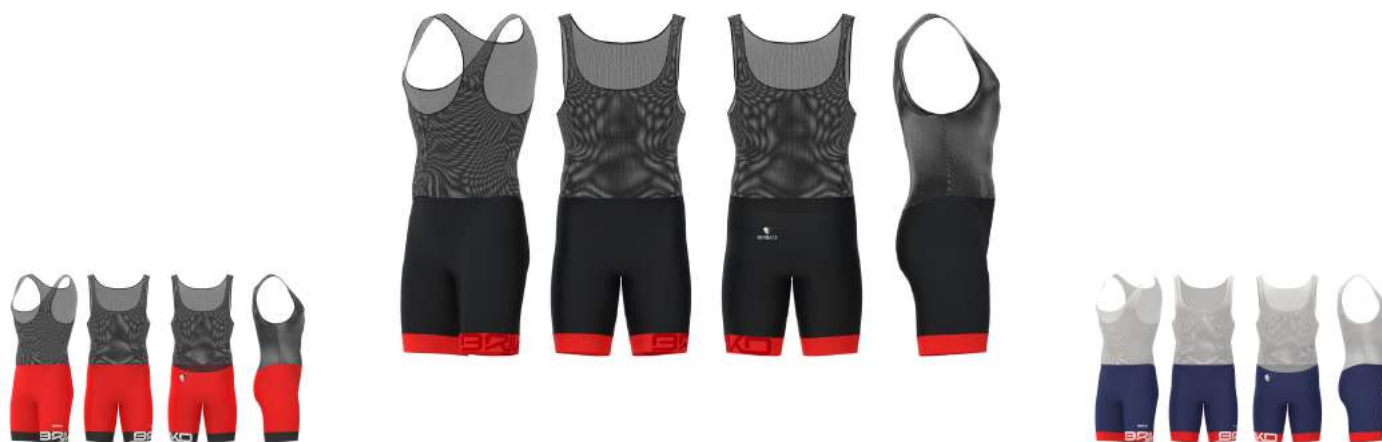
932 Orange Flame-Black