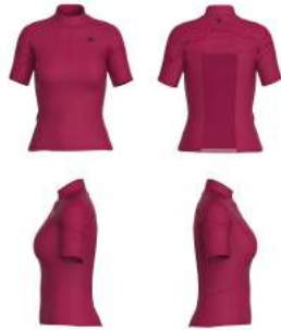
X6R Red Cerise