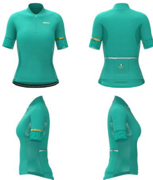
WEU Green Deep