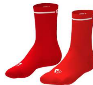
B06 Orange Flame