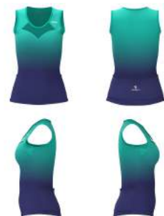
914 Green Deep