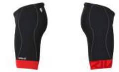
919 Black-Orange Flame