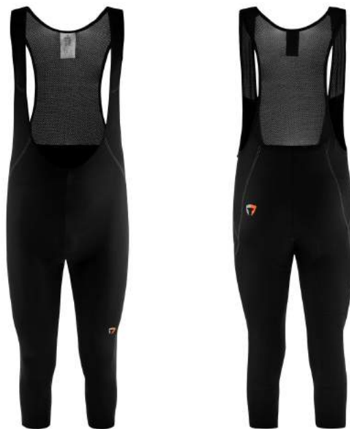
900 N003 BLACK