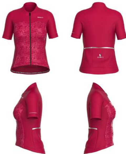
V30 Red Rubine