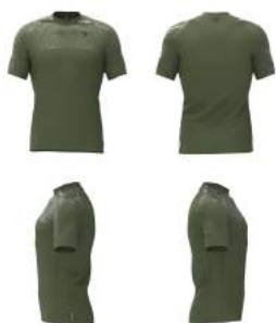
297 Green Dk Forest