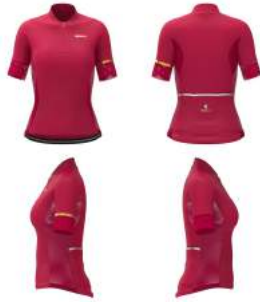
V30 Red Rubine