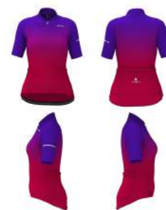
913 Violet Heliotrope