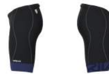
921 Black-Blue Print