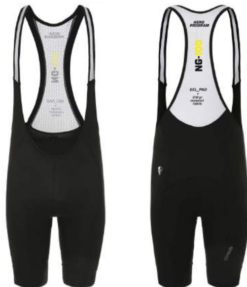
900 N003 BLACK