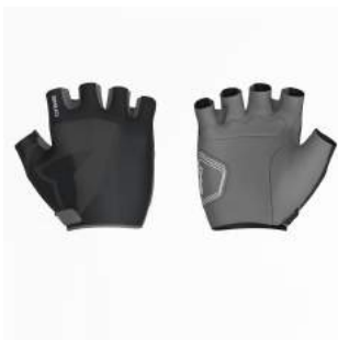
917 Grey Dk-Black