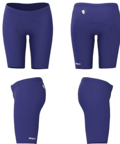
D42 Blue Clematis