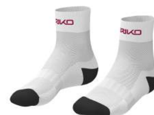
908 White-Black Bean