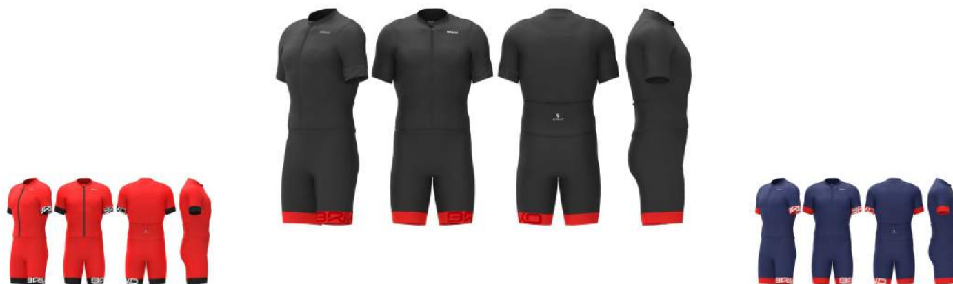
932 Orange Flame-Black